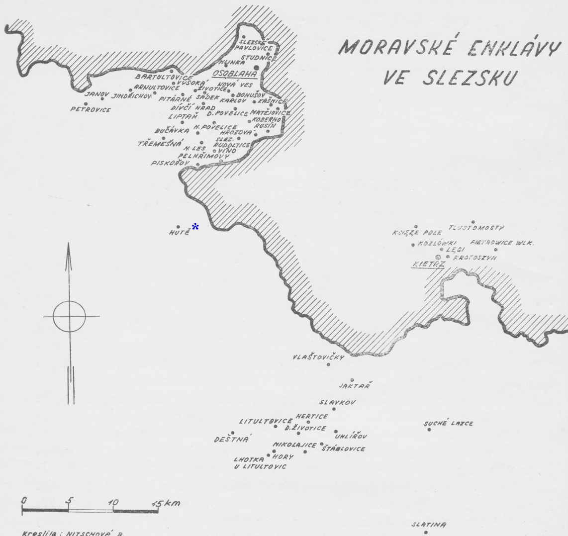
Obr. č. 1. Moravské enklávy ve Slezsku. Abbildung Nr. 1. Die mährischen Enklaven in Schlesien.

zřízení, se stal hlavním střediskem Hradec u Opavy. Opava sama se prvně cituje až r. 1195 2) ). Církevně patřila celá oblast biskupství Olomouckému, založenému r. 1063. Jeho severní hranice splývala s moravskou. Prudnicko pak zůstalo ve svazku Olomoucké diecéze značně dlouho, administrativně-státoprávně však